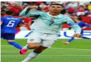
Cristiano Ronaldo: «Este juego significó mucho para nosotros»