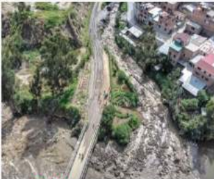
Gobierno peruano declara en emergencia 796 distritos por lluvias

Utilizan drones y perros de rescate para determinar la forma de liberar a un niño atrapado entre los escombros en La Guaira