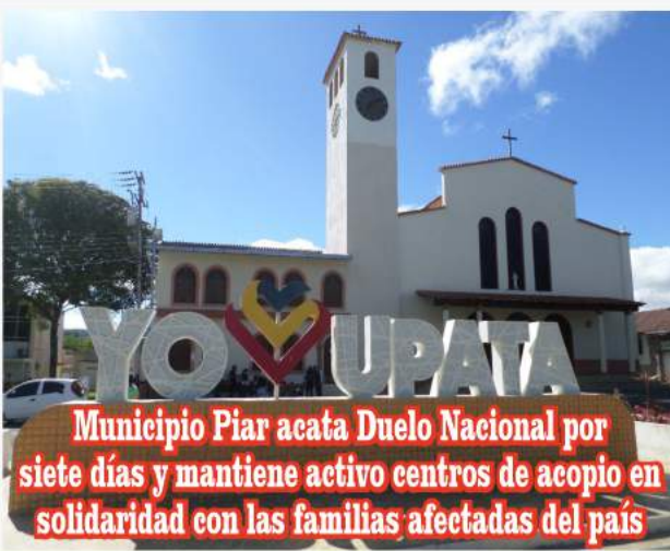
Municipio Piar acata Duelo Nacional por siete días y mantiene activo centros de acopio en solidaridad con las familias afectadas del país