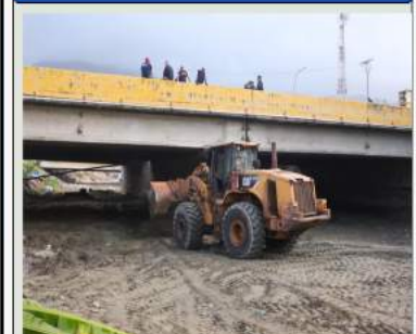
CVG y Sidor rehabilitan el Puente Caraballeda: un compromiso con la recuperación de La Guaira