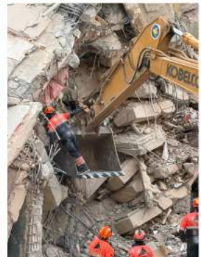
una mano amiga a los venezolanos.