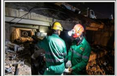
Más de 500 profesionales del sector minero y las industrias básicas participan en las labores de rescate en La Guaira

fallecidas. Heridos: Un total de 12.666 ciudadanos han resultado lesionados. Rescatados: Las intensas labores de salvamento han logrado poner a salvo a 6.462 personas entre los escombros. Pacientes atendidos: Los servicios de salud pública y de campaña reportan la atención médica directa de 20.909 pacientes. Despliegue de seguridad, rescate y voluntariado Efectivos desplegados: Un contingente de 29.567 funcionarios de seguridad y protección se mantienen activos en las zonas de desastre.