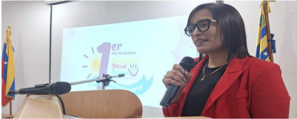
gobernadora Yulisbeth García.

Durante estos doce meses de labor ininterrumpida, la institución ha desplegado un trabajo incansable con un profundo sello de amor, orientado a la atención eficiente y oportuna de las familias más vulnerables del estado Bolívar. Esta acción se ejecuta de manera articulada con el equipo de trabajo de la