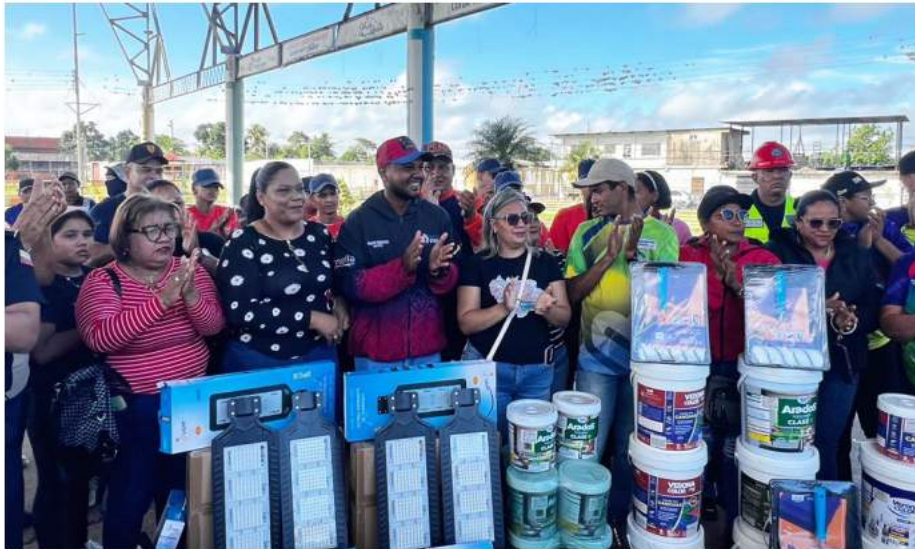
PRENSAALCALDÍA DE PIAR/RP

Una transformación integral para de vida Upata