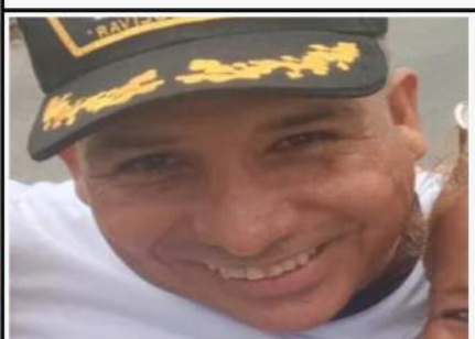
Clippve confirma excarcelación del general de fragata Carlos Piña en Táchira