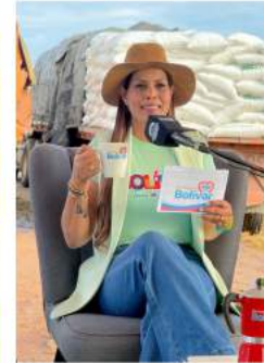
Destacado Asamblea comunal