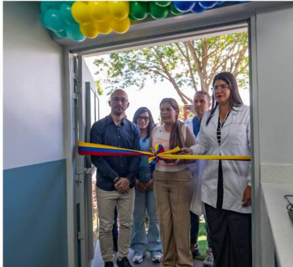
Leales y decididos