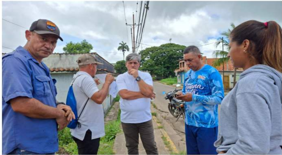
Ciclística Nacional. La competencia deportiva tendrá lugar en la Avenida Las Tres

Inauguración y evento nacional. La culminación de los trabajos de infraestructura está prevista para los próximos días. La inauguración oficial se realizará el venidero 5 de julio de 2026. Este evento servirá como antesala a la 4ta Válida