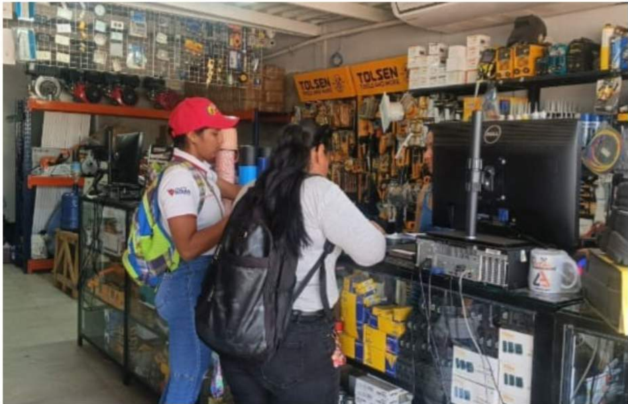
Con este despliegue, el gobierno local busca corregir los márgenes de evasión, promover la transparencia fiscal y garantizar que los tributos se traduzcan en mejoras de los servicios públicos para toda la comunidad de nuestro municipio Sifontes.

Esta medida responde a inconsistencias detectadas entre la actividad económica real observada y los ingresos reflejados en las declaraciones juradas de los contribuyentes.