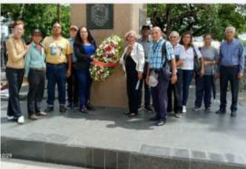
Partido Convergencia conmemoró aniversario 33 de fundado en Upata