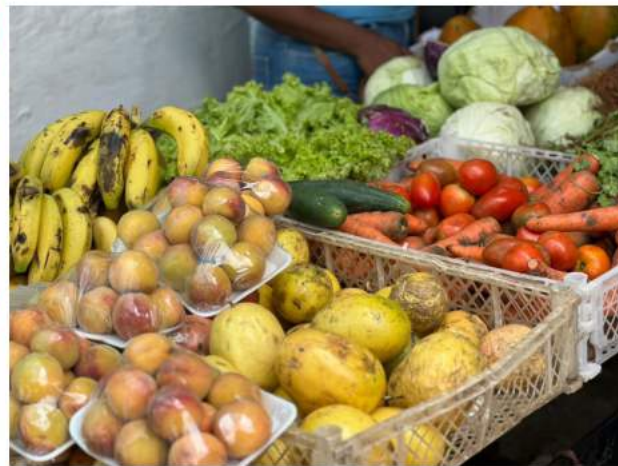
Cupapuycito, Siglo XXI, Bolívar-Chávez.