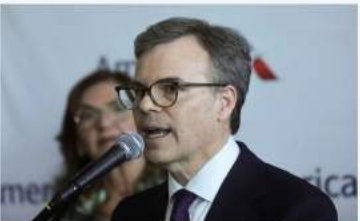
John Barrett: Exportaciones petroleras de Venezuela alcanzan su "nivel más alto" en 7 años