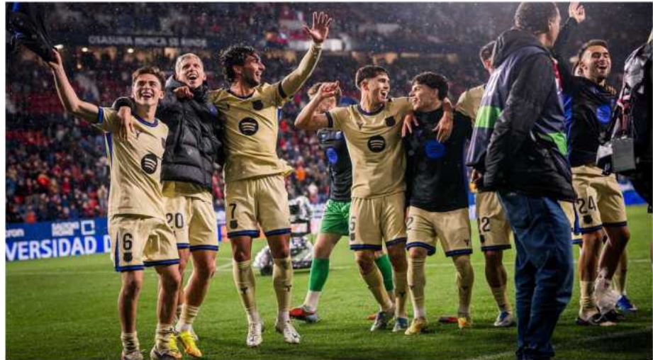
League contra Arsenal.