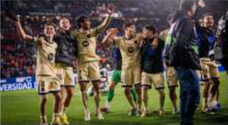
Barcelona se acerca al título tras derrotar a Osasuna 2-1 en LaLiga