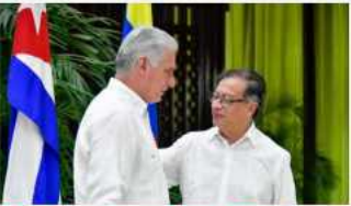
Petro contra Trump: "Son los cubanos y cubanas los únicos dueños de su país"