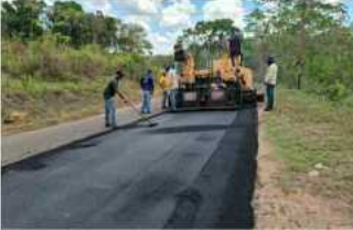
Gobierno Bolivariano continúa asfaltando la vialidad de El Pao y El Palmar

En el primer vehículo bajaron seis mujeres que estaban recluidas en una comandancia de la Guardia Nacional y fueron trasladadas al anexo femenino de la cárcel de Uribana. En los seis autobuses restantes llegaron 60 hombres provenientes de la Comandancia General de la Policía de Yaracuy, reseña el Observatorio Venezolano de Prisiones (OVP), en una nota publicada en su página web.