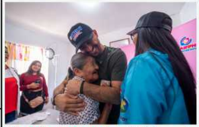
Alcaldía de Caroní realizó jornada integral en parroquia Pozo Verde

Inameh anuncia el inicio de la temporada de ondas tropicales: sepa cuándo llegará la primera