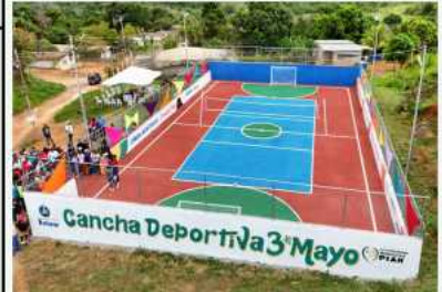
Reinaugurada cancha deportiva en el sector 3 de Mayo

Llegan a Venezuela seis menores de edad en un «vuelo especial» desde EE. UU.