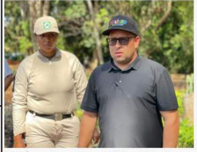
Bolívar impulsa el Plan Nacional de Reforestación Chuquisaca