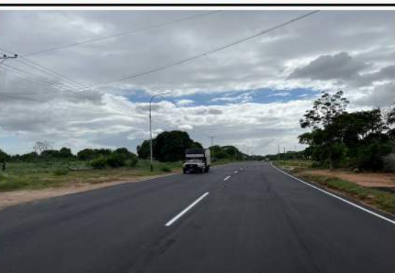
Continúan labores de demarcación en el Corredor vial Hugo Chávez en Ciudad Bolívar