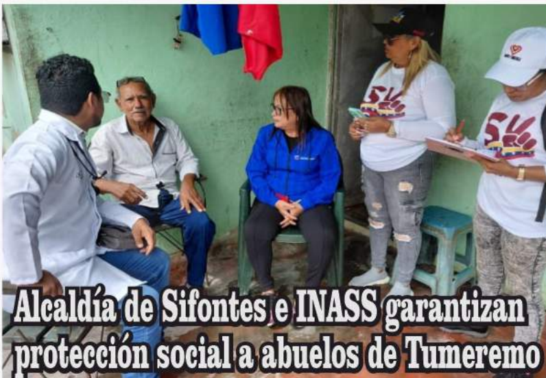
Alcaldía de Sifontes e INASS garantizan protección social a abuelos de Tumeremo