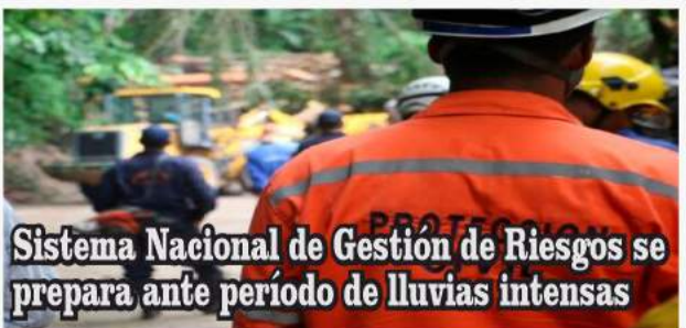
Sistema Nacional de Gestión de Riesgos se prepara ante período de lluvias intensas

El objetivo es derribar barreras y garantizar el bienestar integral de la población estudiantil con necesidades especiales.