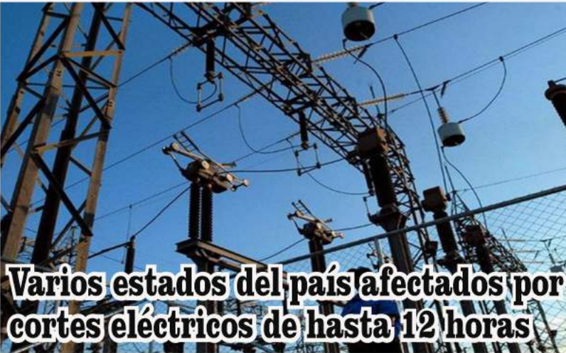
Varios estados del país afectados por cortes eléctricos de hasta 12 horas

La movilización se produjo días después de que Washington presentara cargos contra el expresidente cubano Raúl Castro por el derribo de dos avionetas de la organización Hermanos al Rescate en 1996.