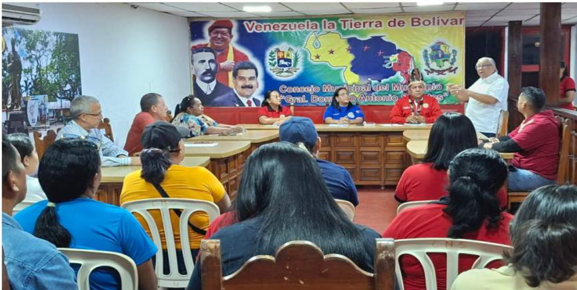
Sánchez durante la clausura del debate parlamentario.

«Desde este Concejo Municipal, en la tierra de Bolívar, acordamos el respaldo total a la defensa de nuestra Guayana Esequiba. Es un deber patriótico que asumimos con orgullo», expresó la concejala