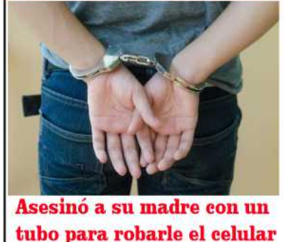
Asesinó a su madre con un tubo para robarle el celular