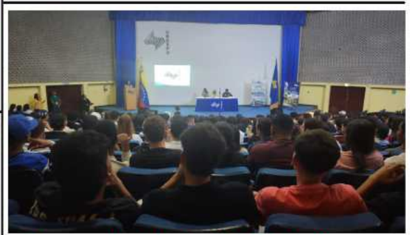
Con unas entusiastas jornadas de Inducción, en la Unexpo Puerto Ordaz, recibieron a 279 nuevos ingresos

La Plataforma Unitaria Democrática (PUD) ratificó que el próximo domingo, 12 de abril, desarrollará un Pleno Nacional en una jornada en la cual sus líderes y representantes estatales presentarán la hoja de ruta para lograr un proceso electoral libre, transparente y con garantías de legitimidad en Venezuela. De acuerdo a la información suministrada por la coalición en una nota de prensa, se espera que durante la actividad participen, vía telemática,