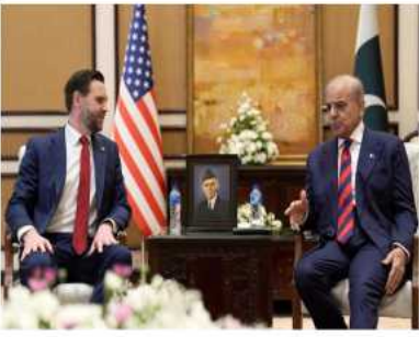
EE.UU. e Irán no logran acuerdos tras 21 horas de diálogo en Islamabad

Con una jornada de inducción llena de dinamismo y entusiasmo, la Universidad Nacional Experimental Politécnica «Antonio José de Sucre», Vicerrectorado Puerto Ordaz, dio la bienvenida al nuevo contingente de estudiantes para el lapso académico 2026-I. La actividad, organizada por la Unidad Regional de Bienestar y Desarrollo Estudiantil (Urbepo), se realizó los días 8, 9 y 10 de abril, con la finalidad de que los futuros ingenieros conozcan y se integren al campus universitario.