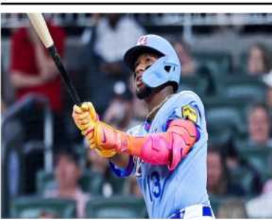
Ronald Acuña Jr. conecta su primer cuadrangular de la temporada ante Cleveland