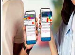
96 % de las transacciones comerciales en Venezuela se realizan por vía digital