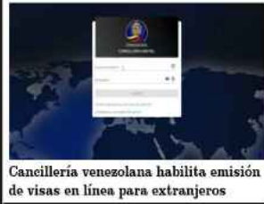
Cancillería venezolana habilita emisión de visas en línea para extranjeros