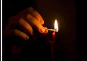
Vecinos de Ciudad Bolívar exigen respuestas ante apagón de 17 horas