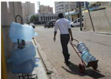
Cendas-FVM incrementa a $ 703 costo de canasta alimentaria por gastos de botellones de agua