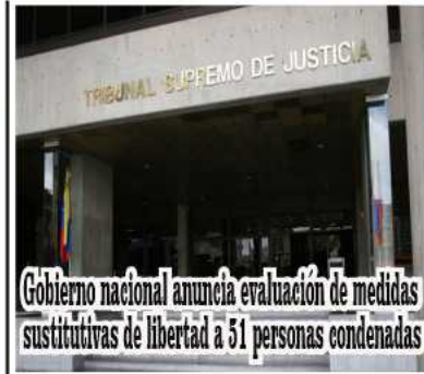
Gobierno nacional anuncia evaluación de medidas sustitutivas de libertad a 31 personas condenadas