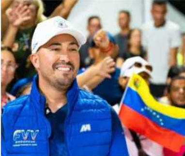
Desde El Malecón Por Yanny Alonzo