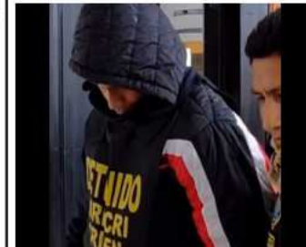
Preso en Aragua un sujeto por perpetrar extorsiones y trata de personas en Perú

Con una solemne ofrenda floral ante la Estatua del Padre de la Patria en la Plaza Bolívar de Upata, las autoridades civiles, militares y policiales del municipio Piar conmemoraron los 216 años de la Declaración de la Independencia de Venezuela. Este hecho histórico, raíz de nuestra gesta libertaria, reafirma el compromiso de la gestión municipal con el legado de Simón Bolívar y el Comandante Hugo Chávez.