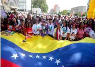
Mujeres venezolanas salen a las calles contra las agresiones racistas a la presidenta Delcy Rodríguez