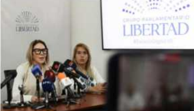
Fracción parlamentaria Libertad pide reforma laboral para proteger el salario de la inflación