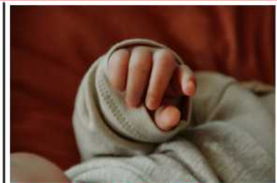
Tragedia en Lagunillas: Madre asesina a su hija de dos años a golpes en un acto incomprensible

Directorio Director Editor: José (Choo) Ladera Columnista y Asesor Jurídico: Dr. Raimond Gutiérrez Colaboradores Licda: Zuleima Idrogo CNP 18.404 Licda: Rosangely Brucez CNP 26.291 Licda: Yhonny Rodríguez | CNP 25.976 Columnista: Luis Bartolo Luiji