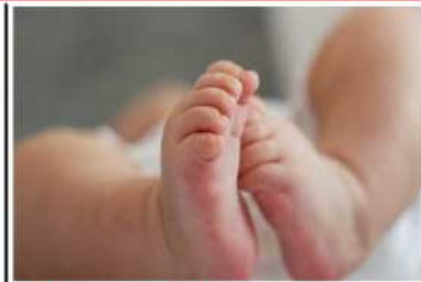
Mata a su hijastro de cuatro meses: la madre se lo dejó para irse de fiesta