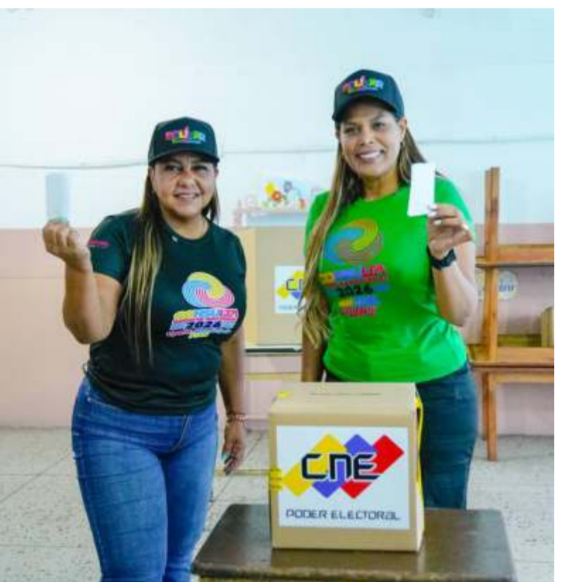
Pueblo de Bolívar participó masivamente en primera Consulta Popular Nacional 2026