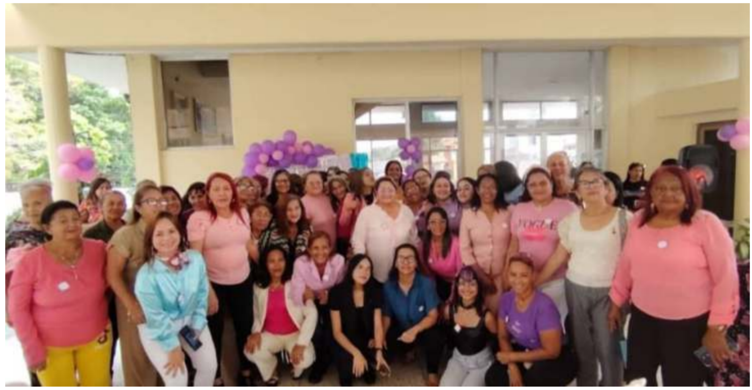
Mujeres de Ciudad Bolívar conmemoran su día bajo el enfoque de la Sostenibilidad y el Liderazgo