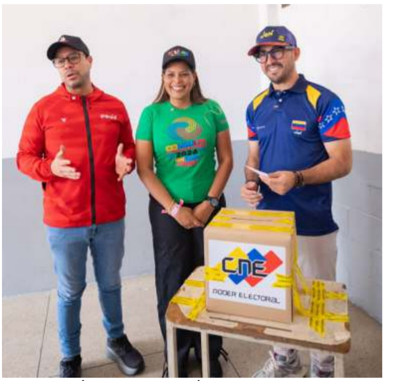
Caroní demostró su compromiso en Consulta Popular 2.026