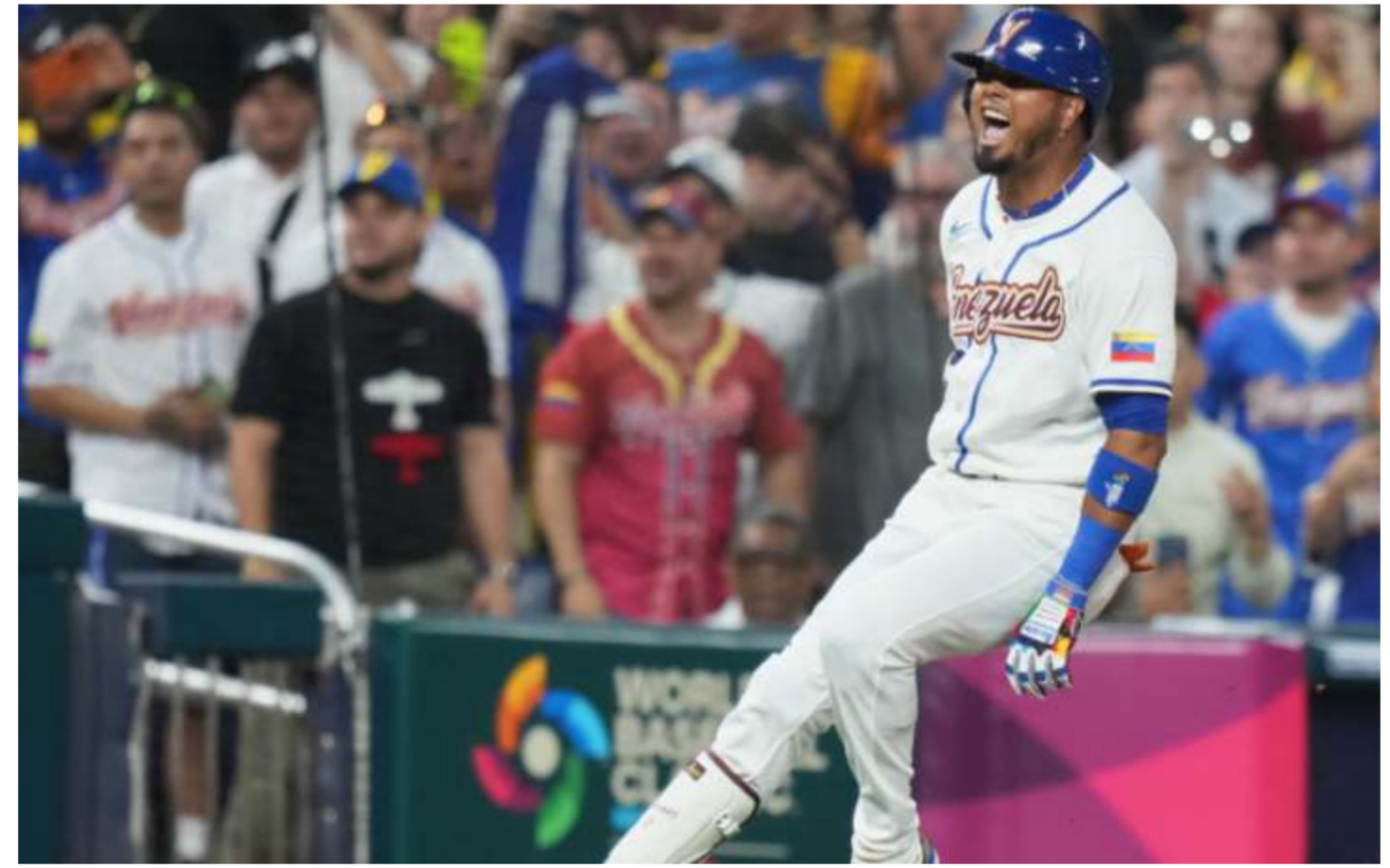
Arráez comandó la ofensiva de Venezuela ante Israel con un marcador de 11-3