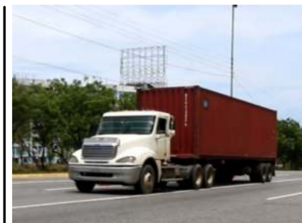
Restringen circulación de transporte de carga pesada desde el lunes 30 de marzo hasta el lunes 6 de abril