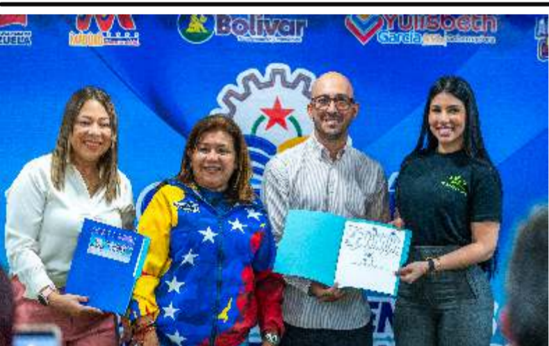
Alcalde de Caroní entregó licencias para actividades económicas