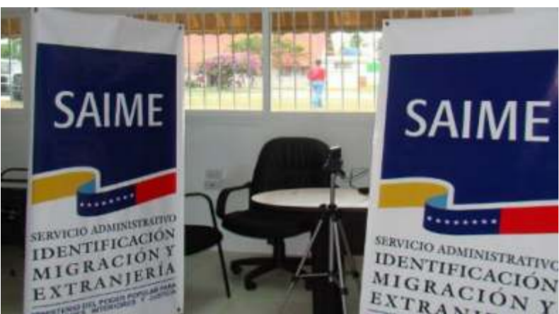
Saime detiene sus operaciones debido al descanso de Semana Santa

“Hemos ideado una programación para que el pueblo disfrute en paz y en familia de esta temporada llena de fe, hermandad y el acercamiento con nuestro Padre”, afirmó García.