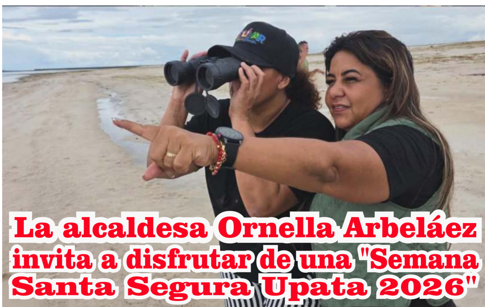
La alcaldesa Ornella Arbeláez invita a disfrutar de una "Semana Santa Segura Upata 2026"