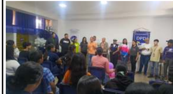
Fveu impulsa ponencia sobre la violencia digital en mujeres y jóvenes

En los espacios de la Universidad Nacional Experimental Simón Rodríguez (UNESR), Núcleo Ciudad Bolívar, se llevó a cabo una ponencia magistral acerca de la Violencia Digital, en el marco del cierre por el Mes de la Mujer. La actividad fue realizada en conjunto por la Federación Venezolana de Estudiantes Universitarios (FVEU) y la Dirección de Prevención del Delito (DPD) adscrita al Ministerio del Poder Popular para Relaciones Interiores, Justicia y Paz (MIJP) en articulación con el centro de estudiantes de la UNESR y el acompañamiento del Movimiento por la Paz y la Vida en el municipio Angostura del Orinoco.