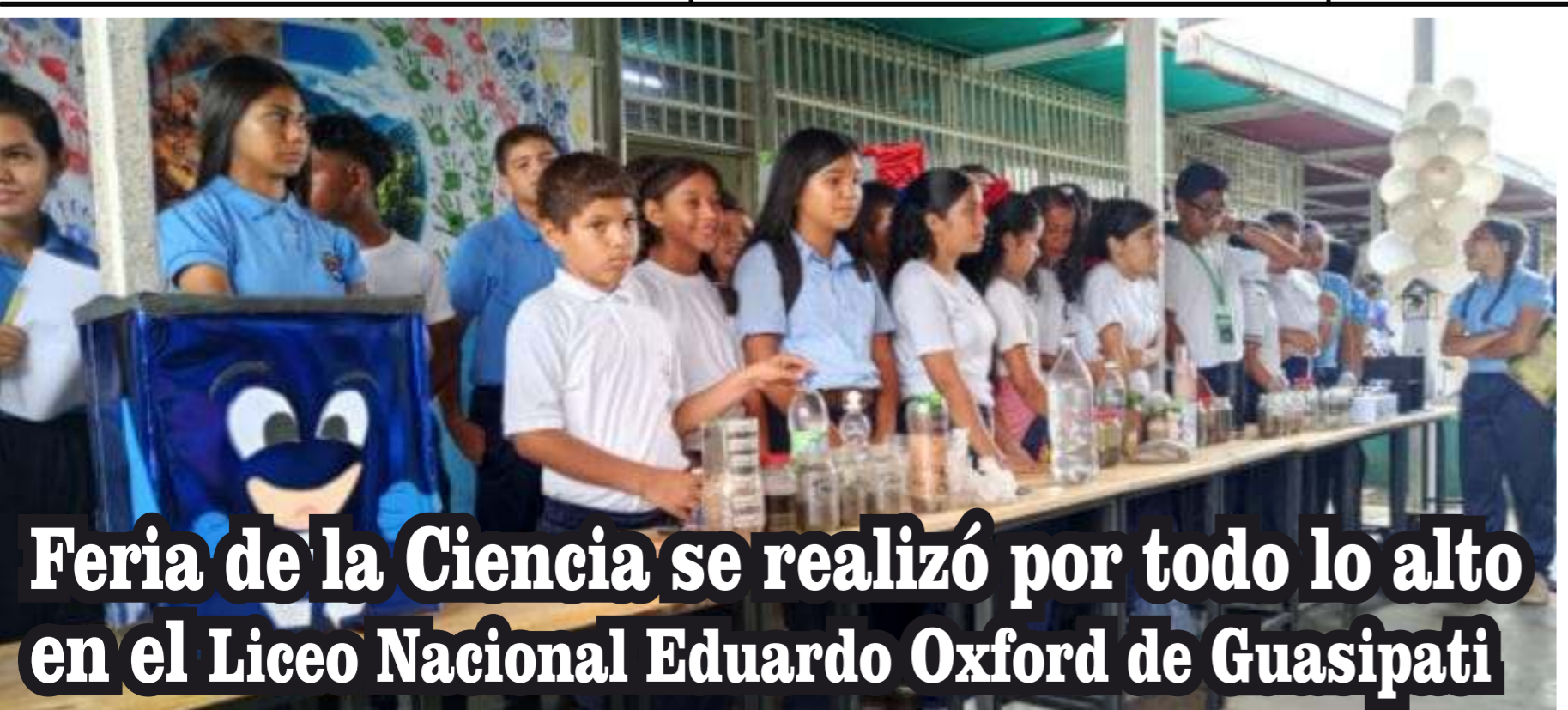
Feria de la Ciencia se realizó por todo lo alto en el Liceo Nacional Eduardo Oxford de Guasipati