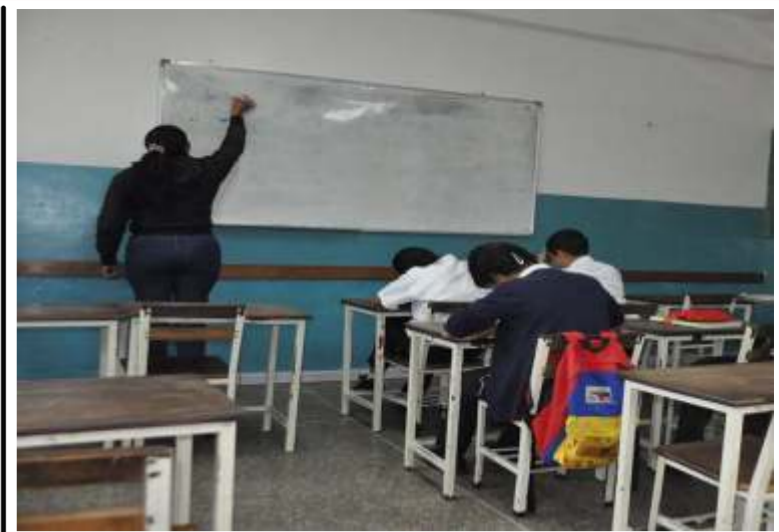
Ministerio de Educación anuncia suspensión de clases por Semana Santa