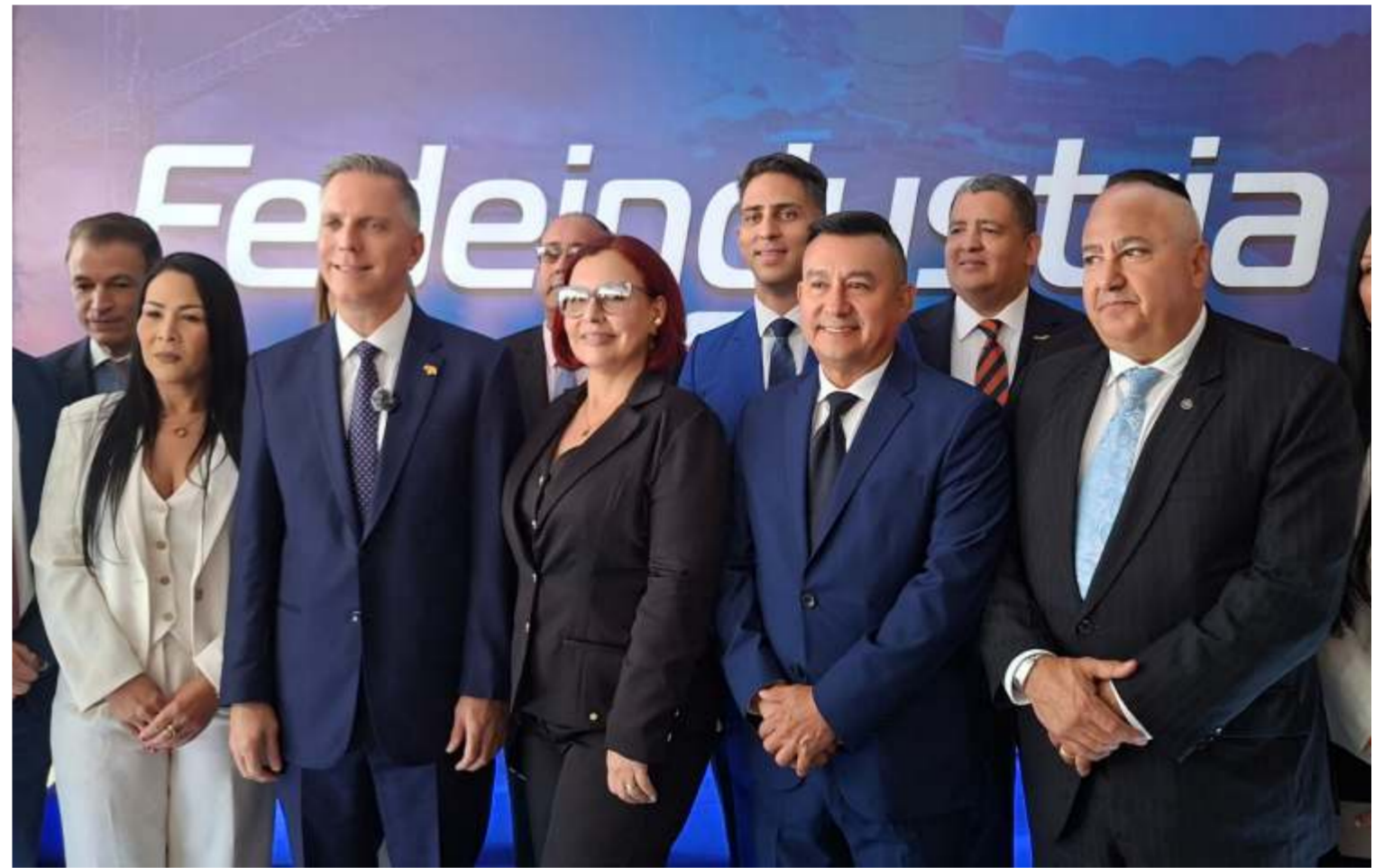
Fedeindustria juramenta la nueva directiva del estado Bolívar para el período 2026-2029