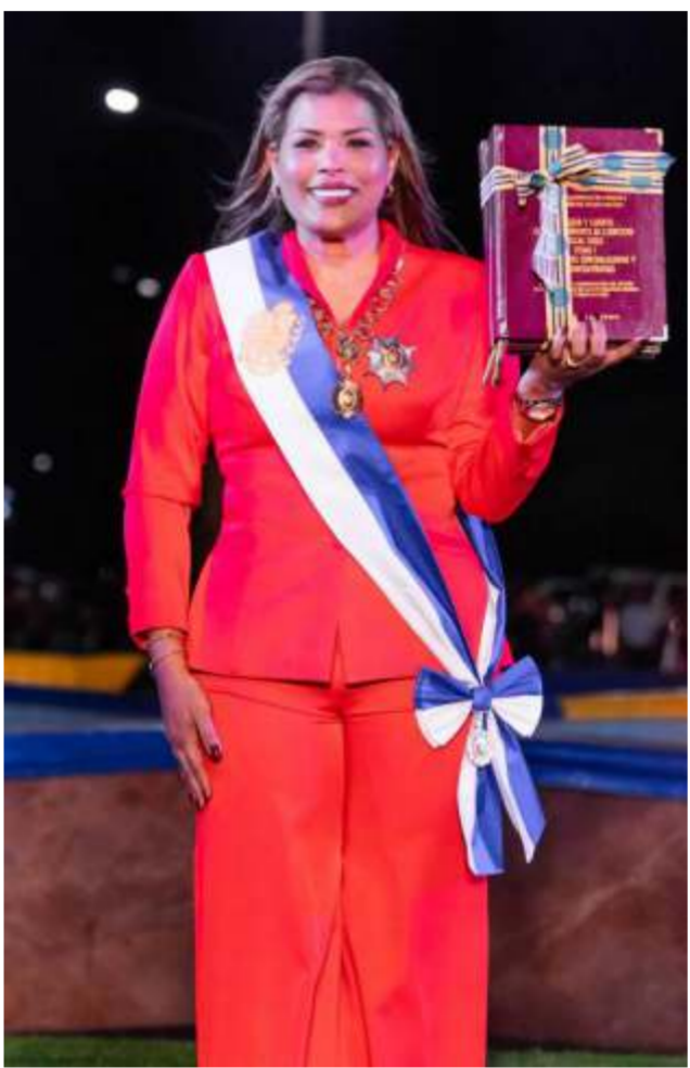
Gobernadora Yulisbeth García presentó Memoria y Cuenta de Gestión Por Amor a Bolívar 2025

Varias protestas se han producido en menos de una semana en distintos sectores de Guasipati; los vecinos denuncian quema de electrodomésticos y horas sin servicio eléctrico. Habitantes de diferentes comunidades del municipio Roscio manifestaron de manera pacífica por los cortes eléctricos que ocurren a diferentes horas del día por espacio de varias horas. Igualmente, denuncian las fluctuaciones eléctricas