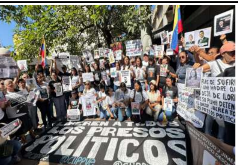
Convocan procesión en Caracas para pedir al Vaticano por presos políticos