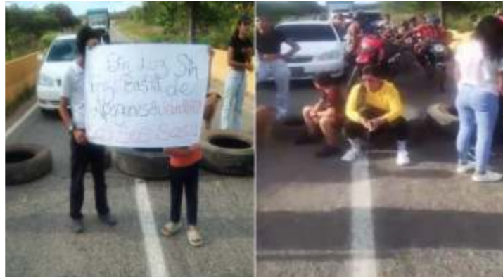
Intensos apagones provocan protestas en el municipio Roscio y El Callao

Varias protestas se han producido en menos de una semana en distintos sectores de Guasipati; los vecinos denuncian quema de electrodomésticos y horas sin servicio eléctrico. Habitantes de diferentes comunidades del municipio Roscio manifestaron de manera pacífica por los cortes eléctricos que ocurren a diferentes horas del día por espacio de varias horas. Igualmente, denuncian las fluctuaciones eléctricas