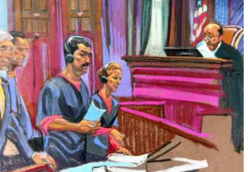
Bloqueo de fondos a Maduro abre grieta en la postura de EE. UU.

El evento se desarrolló en el histórico Paseo Octava Estrella de la ciudad capital, y contó con el respaldo masivo del pueblo y el acompañamiento de las principales autoridades nacionales y regionales.