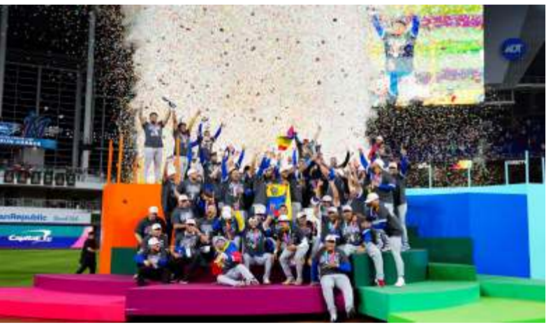
Venezuela ocupa el quinto puesto del ranking mundial de béisbol