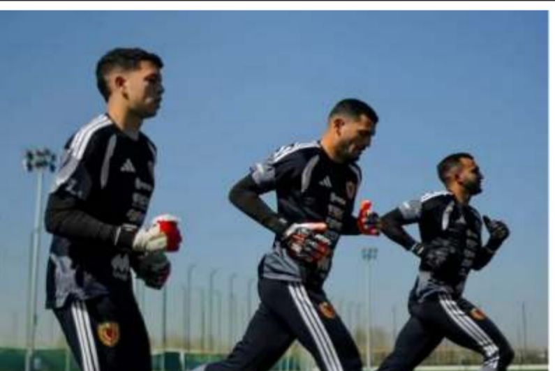
La Vinotinto ya se pone a tono en Uzbekistán

Emergencia de Guaiparo saturada por pacientes con hipertensión e infartos debido al calor