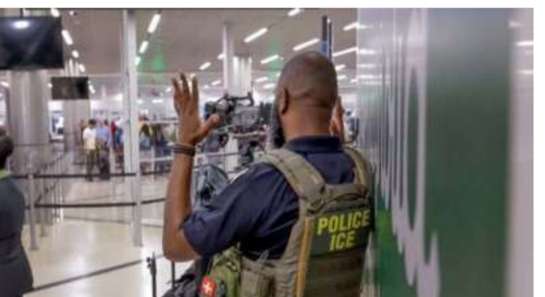
Gobierno de Trump despliega agentes de ICE en aeropuertos ante colapso de la seguridad