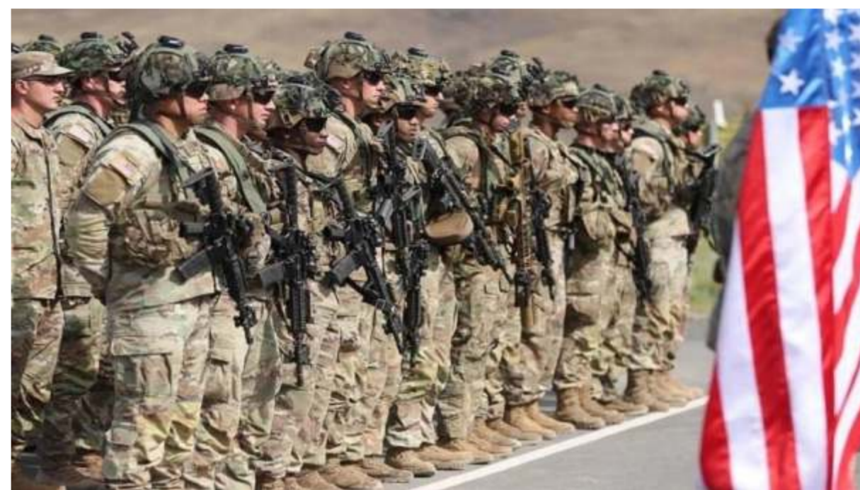
EE.UU. despliega a 4.000 agentes en aguas latinoamericanas en combate contra los carteles

Este espacio de expendio de alimentos fue puesto en servicio, inicialmente en Upata, exactamente en la intersección de las avenidas Valmore Rodríguez y Rómulo Gallegos de Upata, para abaratar los costos, romper la cadena especulativa y frenar la guerra económica contra el pueblo, sobre manera los más vulnerables.