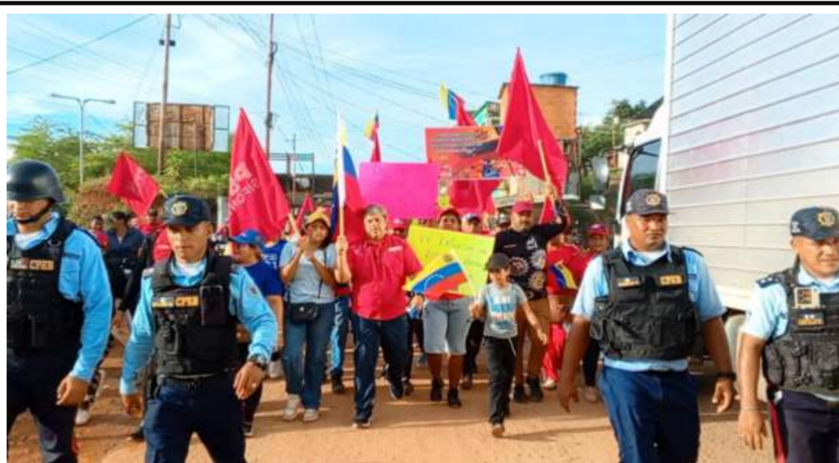
Población El Dorado del municipio Sifontes se movilizó en defensa del presidente Maduro