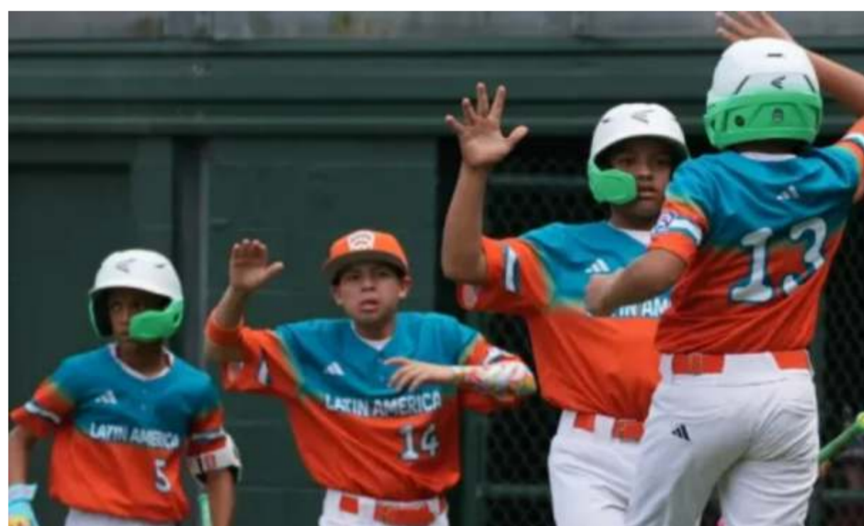
Venezuela mantiene su paso firme en la Serie Mundial de las Pequeñas Ligas