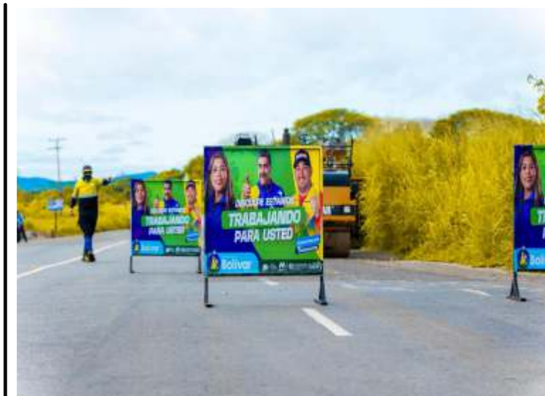
Arrancó plan de asfaltado desde el sector Francisca Duarte hasta El Pao