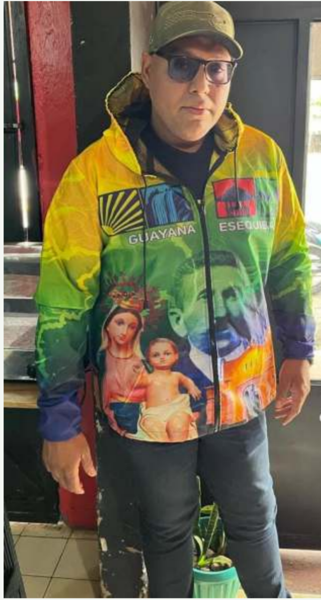
próxima creación de la escuela de bumbac desde el seno de la Fundación C~H calipso Feliz día del calipso