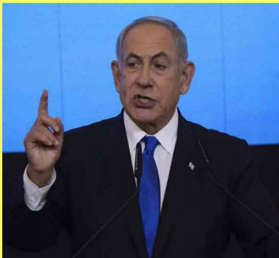
encargado de controlar el enclave palestino de forma temporal. El mandatario israelí reiteró

Más temprano, Netanyahu había dicho, en una conferencia de prensa improvisada tras una reunión que mantuvo con el embajador de India en Israel, J. P. Singh, que el plan de su país no es "anexionar la Franja de Gaza", sino que será un organismo gubernamental, del que no ofreció más detalles, el