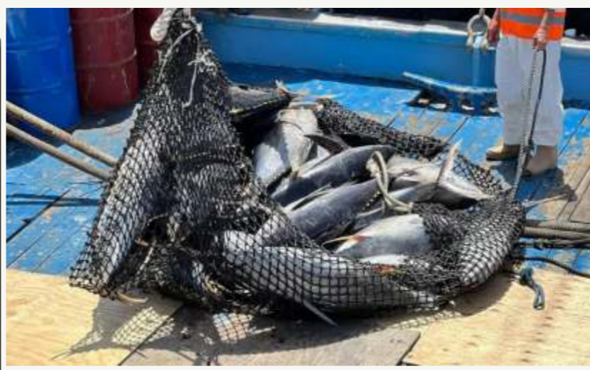
Arriban a Venezuela 900 toneladas de atún del Pacífico para fortalecer la economía

Con la información desde el Sur de Venezuela