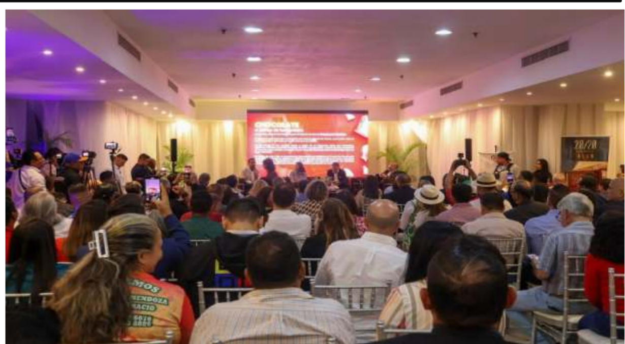
Productores presentaron sus rubros representativos en la Expo Feria “Sabe a Venezuela”