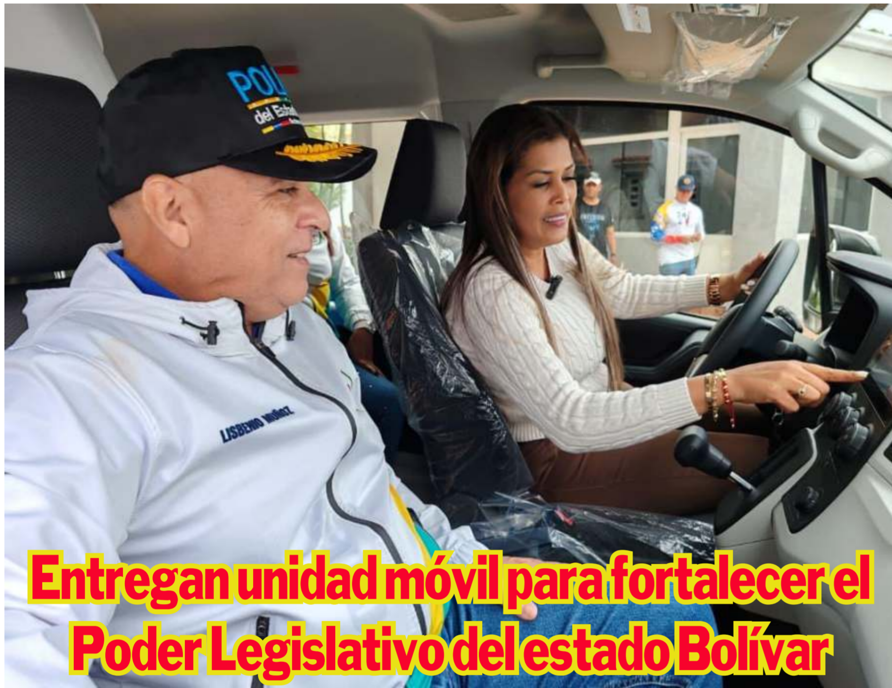
Entregan unidad móvil para fortalecer el Poder Legislativo del estado Bolívar