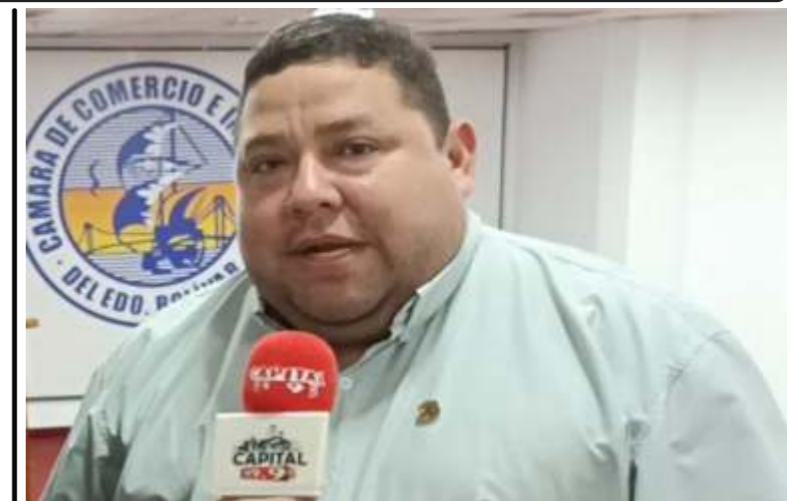
Cámara de Comercio organiza Jornada con INPSASEL