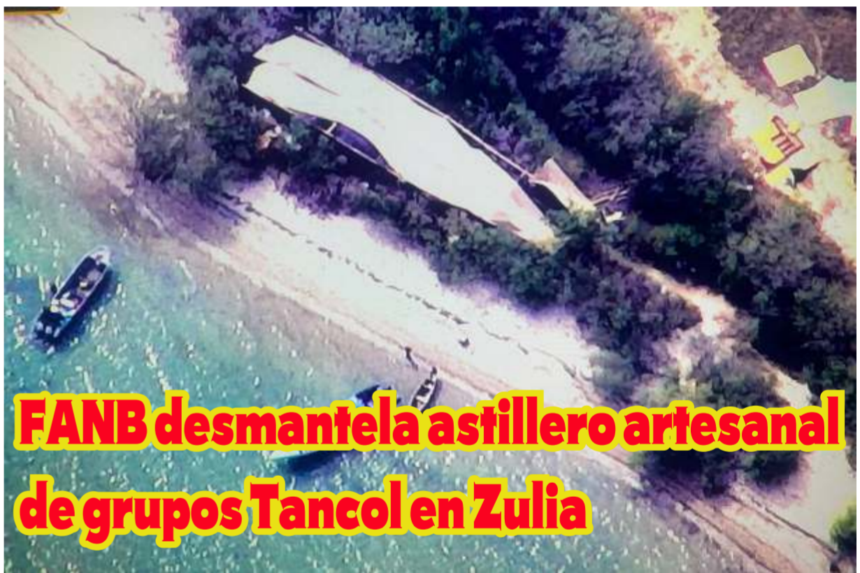
FANB desmantela astillero artesanal de grupos Tancol en Zulia

El intercambio comercial entre Venezuela y Colombia registró un aumento notable en la primera mitad de 2025, con un crecimiento sostenido en exportaciones e importaciones que alcanzaron los 180 millones de dólares a través del estado Táchira, informó este domingo la Cámara de Integración Económica Venezolano-Colombiana (Cavecol).