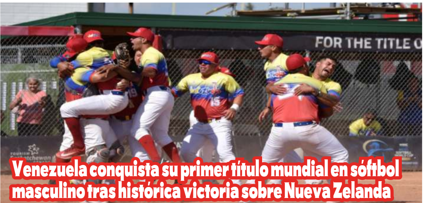
Venezuela conquista su primer título mundial en fútbol masculino tras histórica victoria sobre Nueva Zelanda

La OMS recomienda por primera vez el uso del Lenacapavir para prevenir el VIH