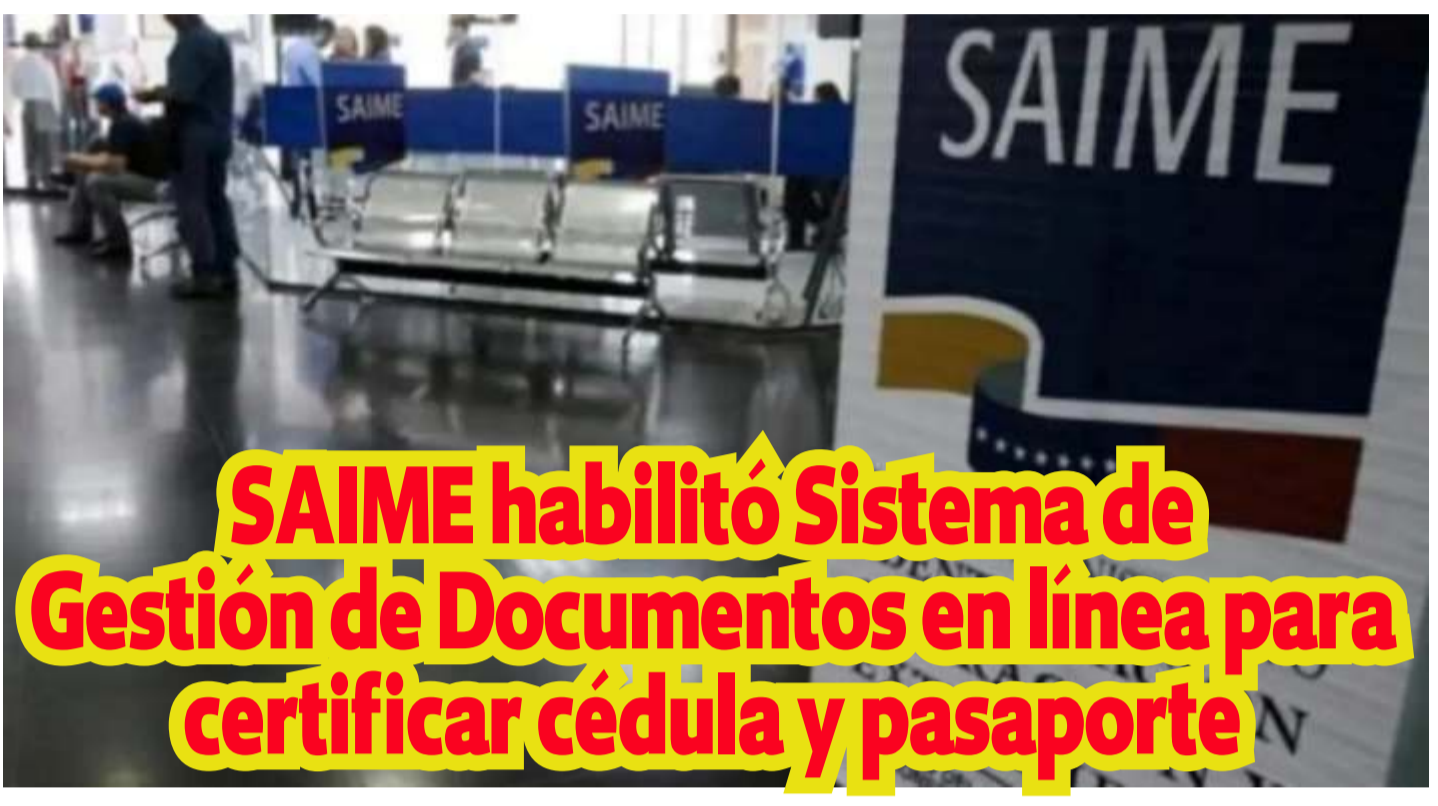
SAIME habilitó Sistema de Gestión de Documentos en línea para certificar cédula y pasaporte