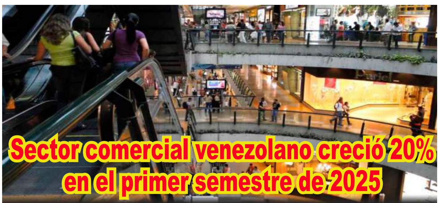
Sector comercial venezolano creció 20% en el primer semestre de 2025