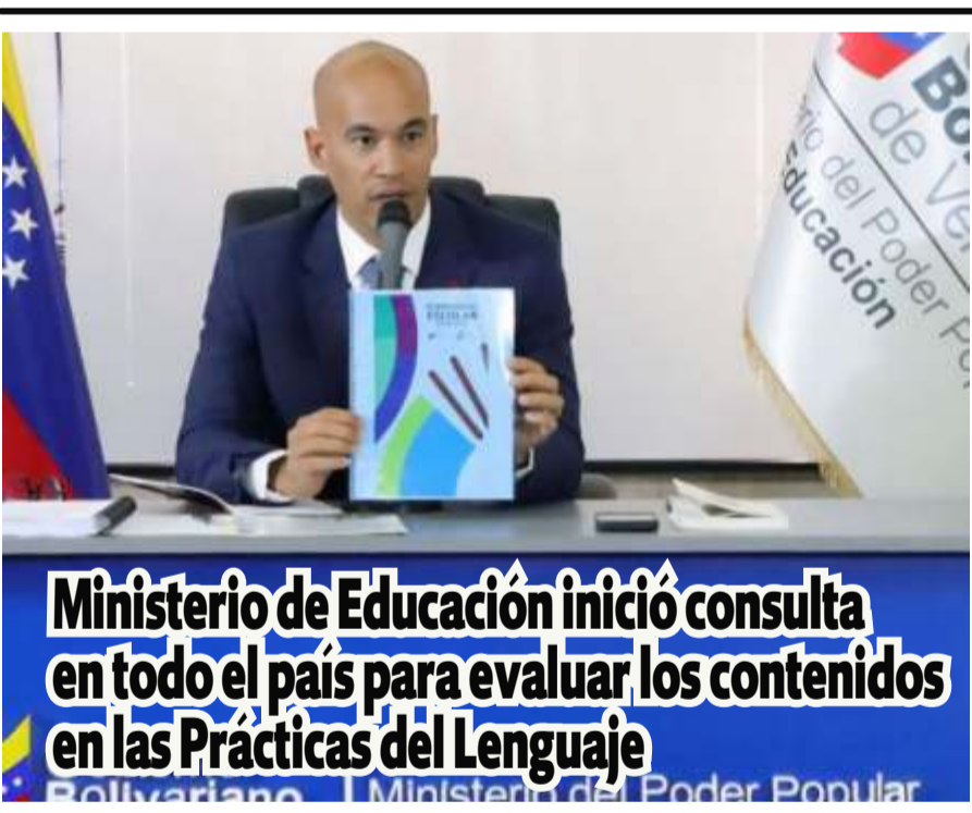
Ministerio de Educación inició consulta en todo el país para evaluar los contenidos en las Prácticas del Lenguaje

El Ministerio del Poder Popular para la Educación, bajo la dirección del ministro Héctor Rodríguez, ha puesto en marcha una consulta a nivel nacional para la adecuación de los contenidos en el área de Lenguaje, que pasará a denominarse «Prácticas del Lenguaje». Esta iniciativa busca modernizar y ajustar el currículo de la Educación Básica en Venezuela.