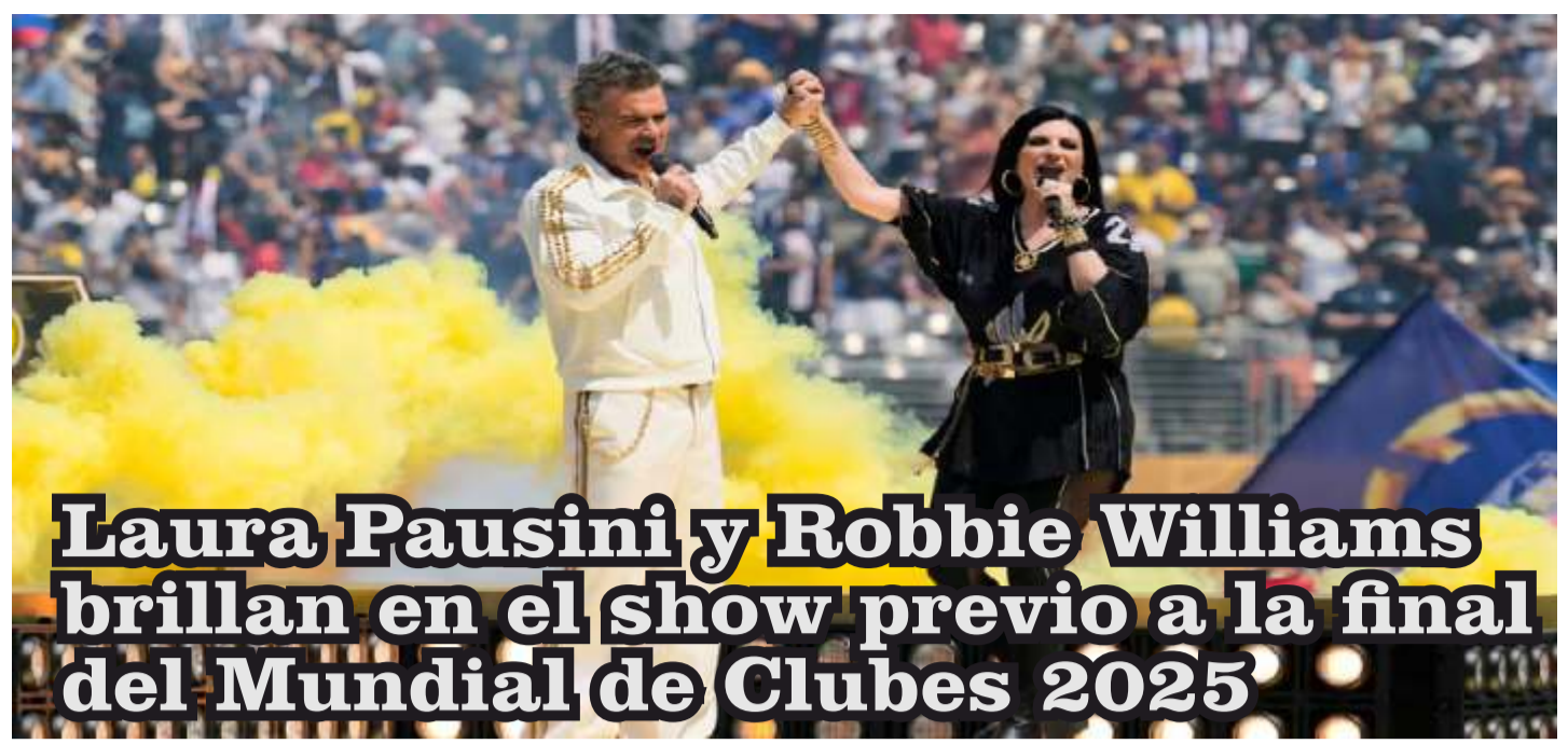
Laura Pausini y Robbie Williams brillan en el show previo a la final del Mundial de Clubes 2025