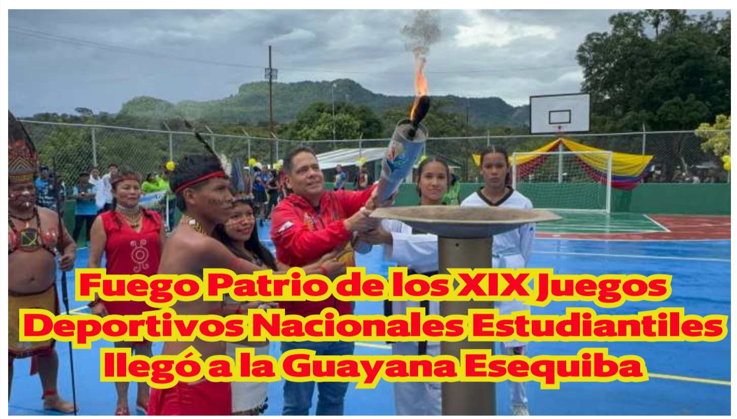
Fuego Patrio de los XIX Juegos Deportivos Nacionales Estudiantiles llegó a la Guayana Esequiba