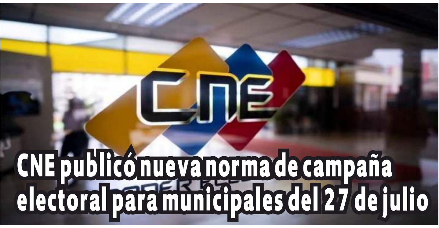
CNE publicó nueva norma de campaña electoral para municipales del 27 de julio

¡Se acabó el jueguito! COPEI ratifica a Djeluis Lugo como el único candidato legítimo de la oposición democrática en el municipio Roscio