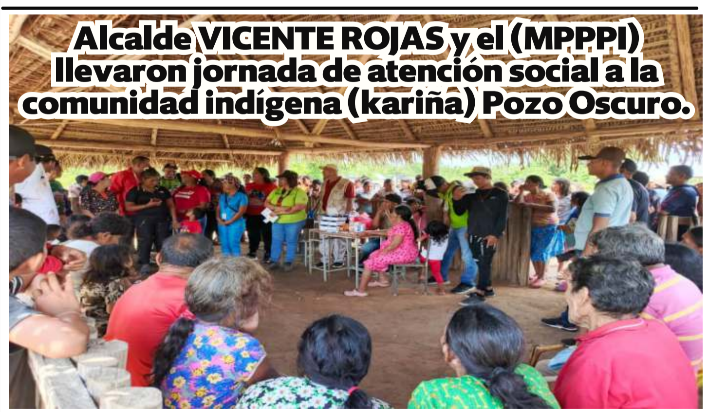
Alcalde VICENTE ROJAS y el (MPPPI) llevaron jornada de atención social a la comunidad indígena (kariña) Pozo Oscuro.