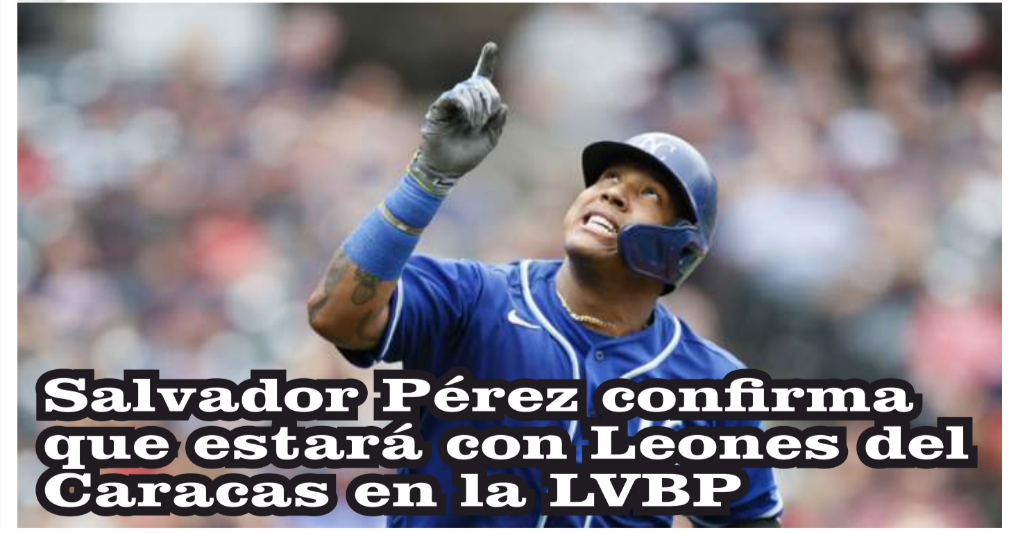
Salvador Pérez confirma que estará con Leones del Caracas en la LVBP