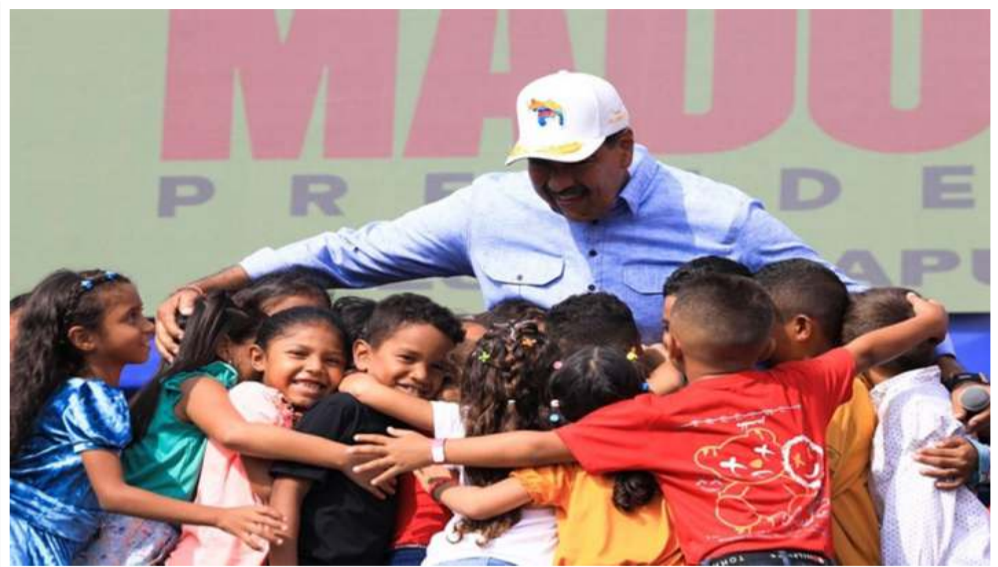
Presidente Maduro a los niños en su día: "Son el futuro de nuestra patria"