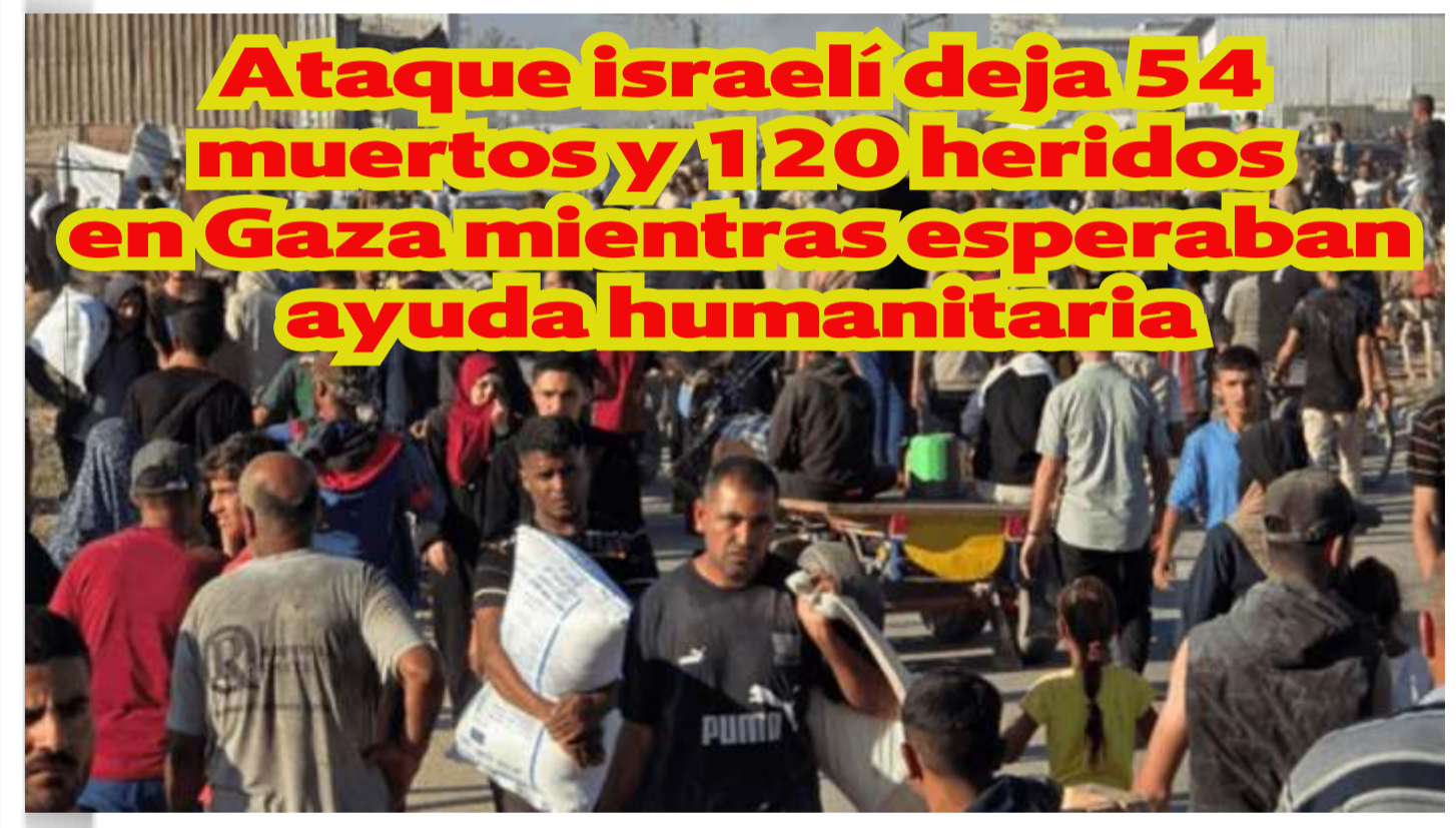
Ataque israelí deja 54 muertos y 120 heridos en Gaza mientras esperaban ayuda humanitaria