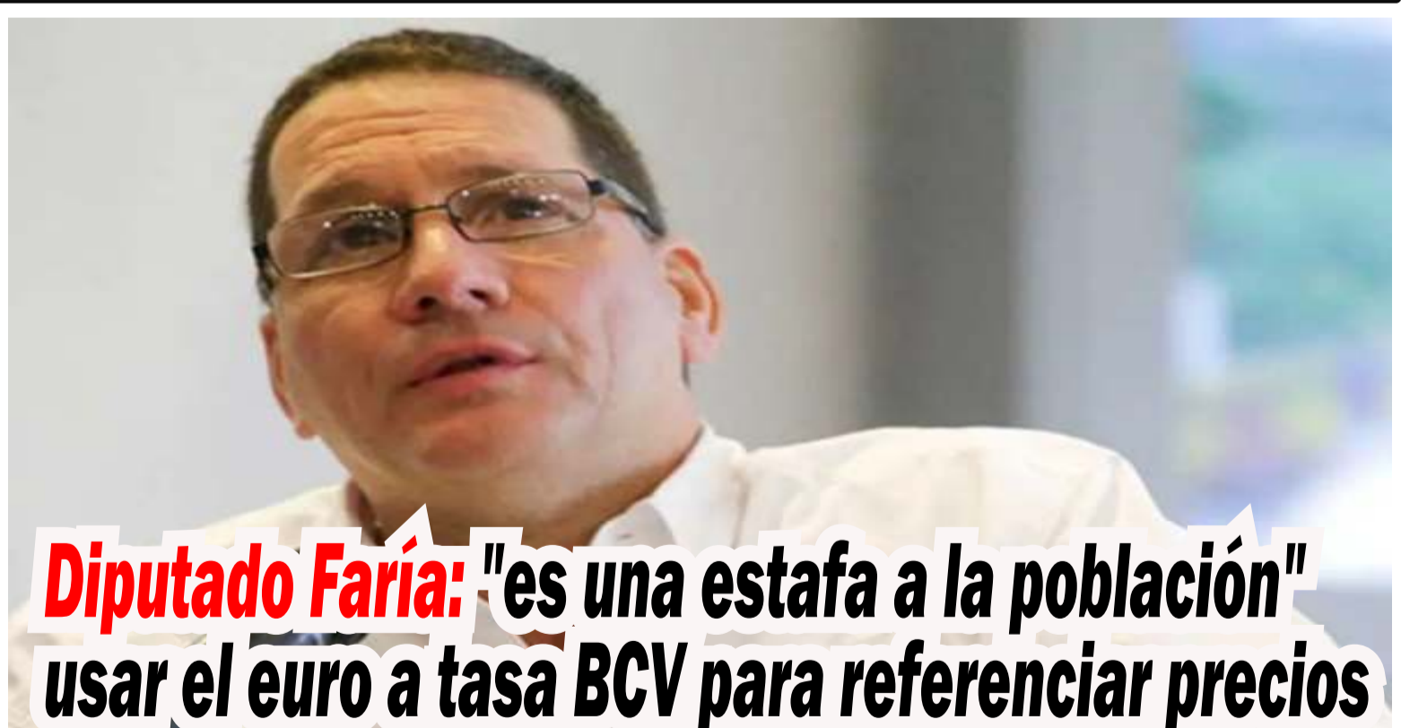
Diputado Faría: "es una estafa a la población" usar el euro a tasa BCV para referenciar precios