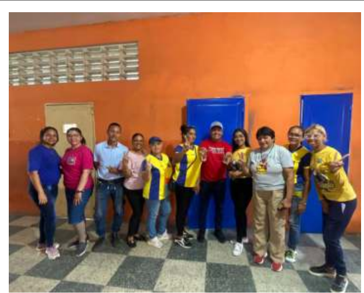
La gestión del gobernador Neil Villamizar inicia con pasos firmes en pro del desarrollo educativo