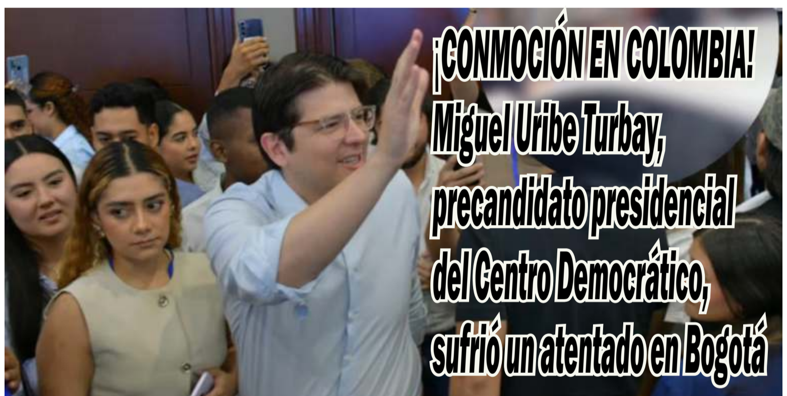
¡CONMOCIÓN EN COLOMBIA! Miguel Uribe Turbay, precandidato presidencial del Centro Democrático, sufrió un atentado en Bogotá