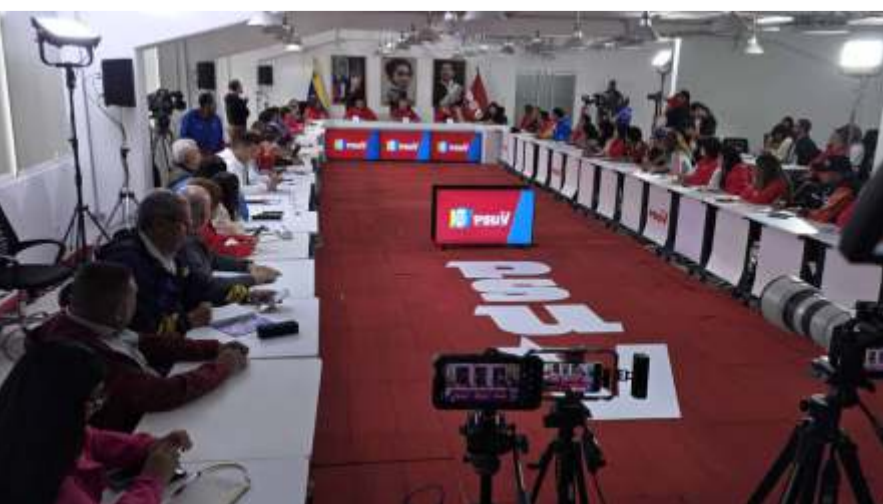
Afirmó el Dr. Sulbaran La Revolución sigue dando ejemplo de liderazgo y organización