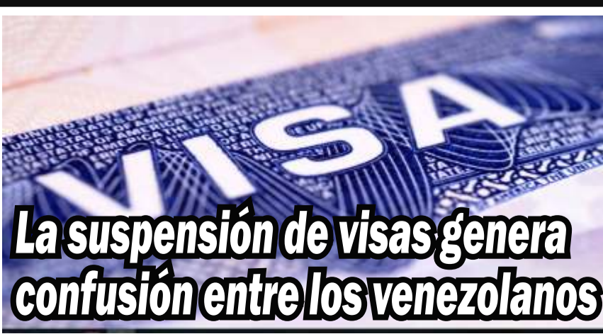
La suspensión de visas genera confusión entre los venezolanos