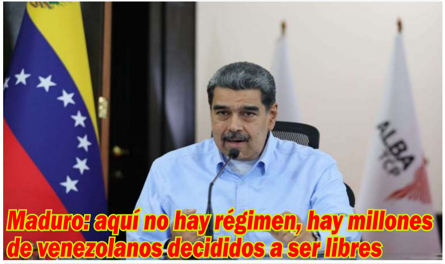
Maduro: aquí no hay régimen, hay millones de venezolanos decididos a ser libres

El despacho ministerial, a través de su cuenta de Instagram, también alertó sobre la circulación de una imagen que contiene información falsa sobre recomendaciones sanitarias, como el uso del tapaboca. "No seas portavoz de informaciones maliciosas y alarmistas", enfatizó el Ministerio.