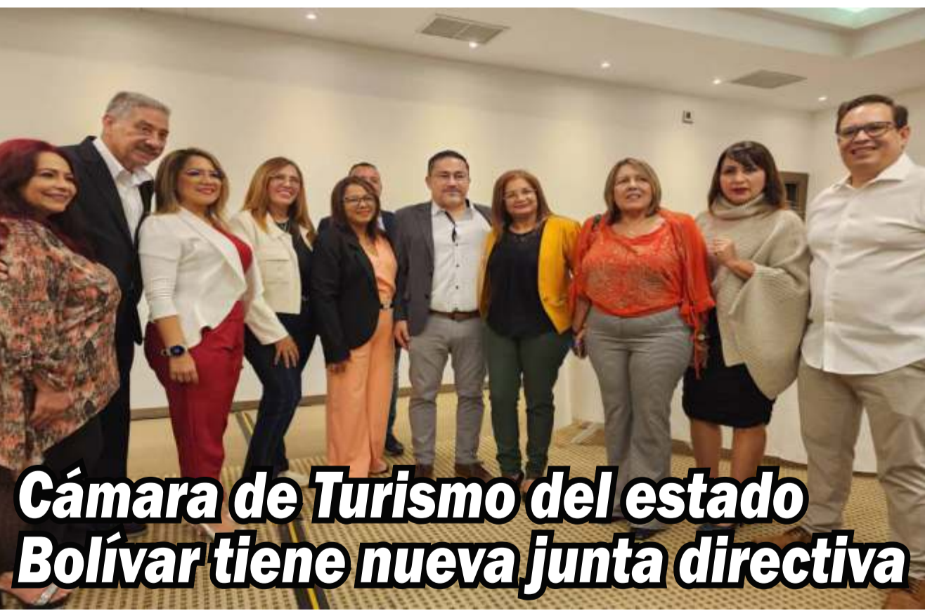
Cámara de Turismo del estado Bolívar tiene nueva junta directiva