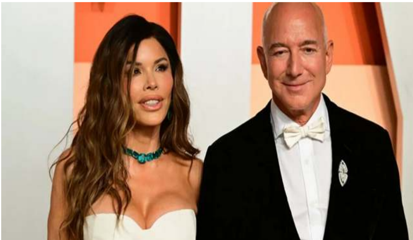
Jeff Bezos, con su cara de "yo no fui", y Lauren Sánchez, con el rostro desfigurado por el bótox, pudieron convertir su romance, que nació como una infidelidad, en una boda multimillonaria que algunos habitantes de Venecia han interpretado como una burla, como si ambos lanzaran billetes de dólares a los canales cual papelillo.

Alojados en el Aman Venice ( https://www.aman.com/hotels/aman-venice/ ), el hotel más lujoso de Venecia, la pareja aprovechó la cercanía de Koru, el inmenso yate por el cual Bezos pagó 2.500 millones de dólares, para realizar la primera fiesta con invitados de lujo, donde coinciden desde Oprah Winfrey hasta Ivanka Trump, pasando por la Kardashian y Bill Gates.