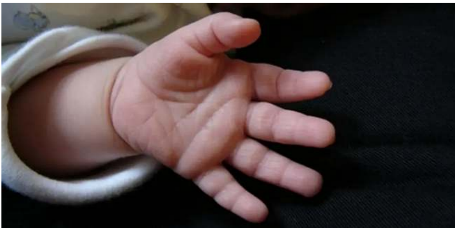
El fiscal general, Tarek William Saab, informó este viernes que el Ministerio Público (MP) investiga a una mujer que expuso intencionalmente a su hijo de un año para que contrajera una bacteria en el estado Zulia.

Según la información que compartió en Instagram, se designó a la Fiscalía 35º con competencia en penal ordinario de víctimas niños, niñas y adolescentes, para llevar a cabo el procedimiento. Asimismo, se encargará de sancionar a