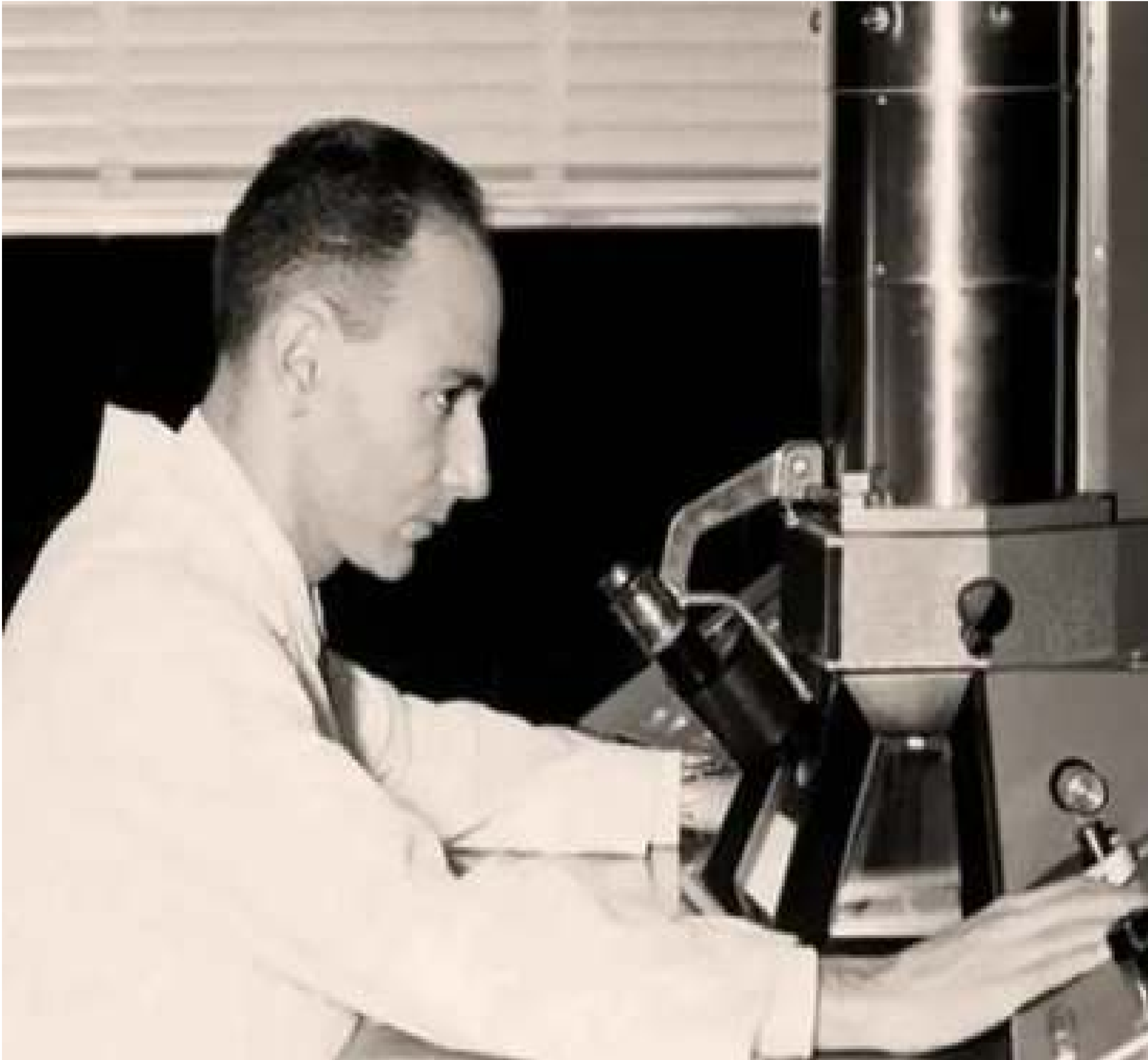
La Asamblea Nacional de Venezuela aprobó este lunes otorgar los honores del Panteón Nacional al destacado médico y científico venezolano Humberto Fernández-Morán, en reconocimiento a su invaluable contribución al campo de la ciencia y la tecnología, tanto a nivel nacional como internacional.

El científico jugó un papel fundamental en la creación del Instituto Venezolano de Investigaciones Científicas (IVIC), una de las instituciones más importantes de Venezuela en el ámbito científico