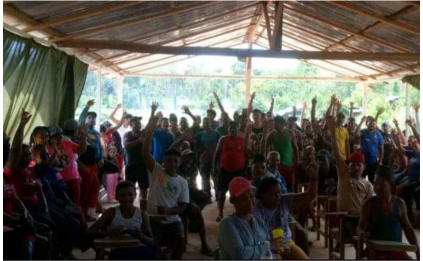
responsable de reportar los postulados mediante la finalizar la asamblea. datos de las postuladas y plataforma CC200 tras

Varias personas de las que participaron en el acto en Sifontes, estuvieron acompañando a su jefa o jefe de comunidad como único